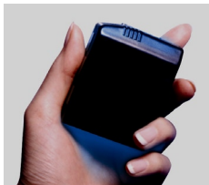
The Portable People Meter NEXT GENERATION ELECTRONIC RATINGS™

Kontakt: reinhold.horstmann@tns-emnid.com